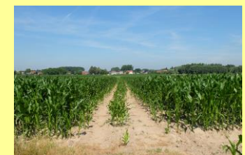
Letterlijk in "open veld" soms door de gewassen!