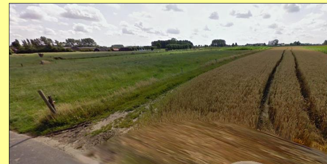
Karreslag rechts in de Hullestraat