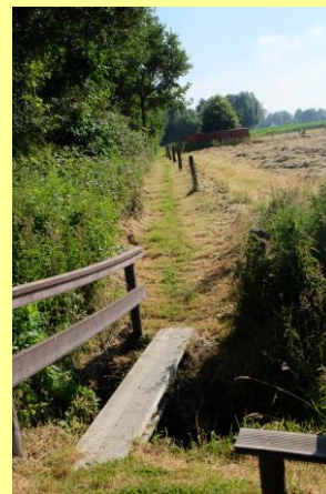
Wandelsluis Lierenbospad Brugje Lierenbospad