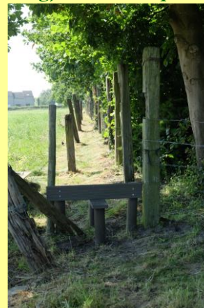
Karreslag aan huisnr 65 Wandelsluis pad 90cm