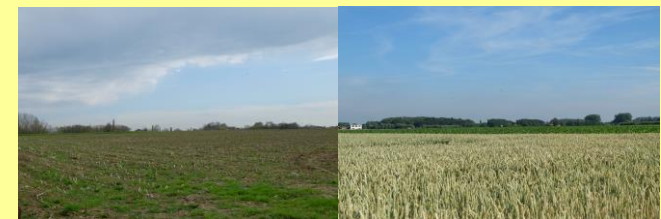
In elk seizoen: weidse zichten