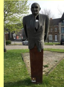
Monument Carlos Dierickx