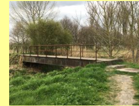
Bruggetje naar Peetjeswegel