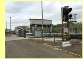
Sluis te Asper

We starten op het Carlos Dierickxplein dat verfraaid is met een vierschaar , een ere-monument en een gedichtenhoekje. We nemen de Steenweg richting Gavere. Net voor de Wallebeek slaan we rechtsaf en volgen de Landdijk. Deze dijk werd reeds aangelegd in de 18de eeuw. Aan onze rechterzijde ontwaren we de restanten van een duiventoren. De Landdijk omsluit hier het Jolleveld (rechts), een zandrug met open landschap waar belangrijke archeologische vondsten werden gedaan zoals bronzen sieraden uit de Romeinse periode en een Merovingische begraafplaats (6de eeuw.) Wat verder zien we links het bruggetje liggen dat ons op de Peetjeswegel brengt. Deze weg werd aangelegd door Henri Dhont (1866>1950.) Hij was de peetvader van de steenbakkers (vandaar: “Peetje” Dhont). Over de Peetjeswegel konden de arbeiders op een vlotte manier naar de steenbakkerijen langs de Schelde stappen. Waar de (korte) Peetjeswegel eindigt, begint de Denkstraat die wij volgen. Aan de T-splitsing: rechts houden tot aan de Schelde waar wij rechtsaf slaan, stroomopwaarts richting sluis .